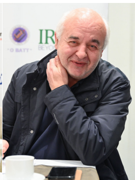
Νίκος Καραθανασόπουλος Κοινοβουλευτικός εκπρόσωπος ΚΚΕ