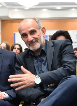
Απόστολος Κατσιφάρας πρώην Περιφερειάρχης Δυτικής Ελλάδος