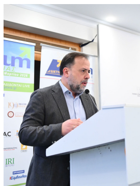
Στυλιανός Μπλέτσας Αντιπεριφερειάρχης Βιώσιμης Ανάπτυξης, Ενέργειας, Χωροταξίας και Περιβάλλοντος