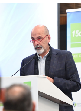
Χαράλαμπος Μπουνός Αναπληρωτής Περιφερειάρχης Περιφέρειας Δυτικής Ελλάδος