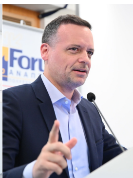
Χάρης Δούκας Δήμαρχος Αθηναίων