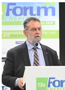
Ανδρέας Παναγιωτόπουλος Βουλευτής ΣΥΡΙΖΑ Αχαΐας