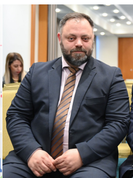
Σπύρος Τσιρώνης Βουλευτής ΝΙΚΗ Αχαΐας